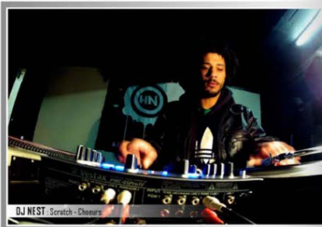
DJ NEST : Scratch - Chœurs