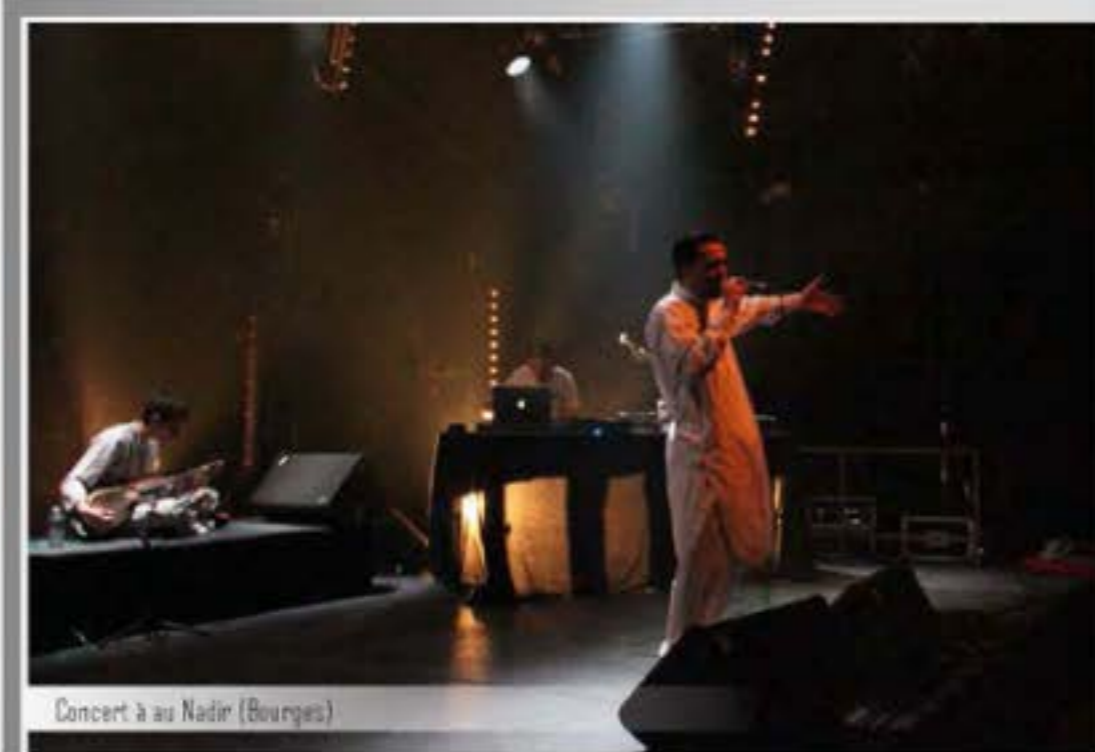
Concert à au Nadir (Bourges)