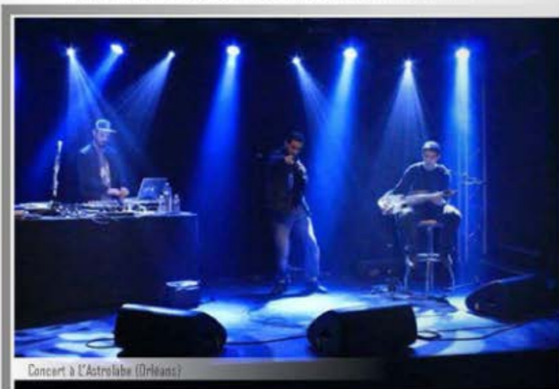
Concert à L'Astrolabe (Orléans)