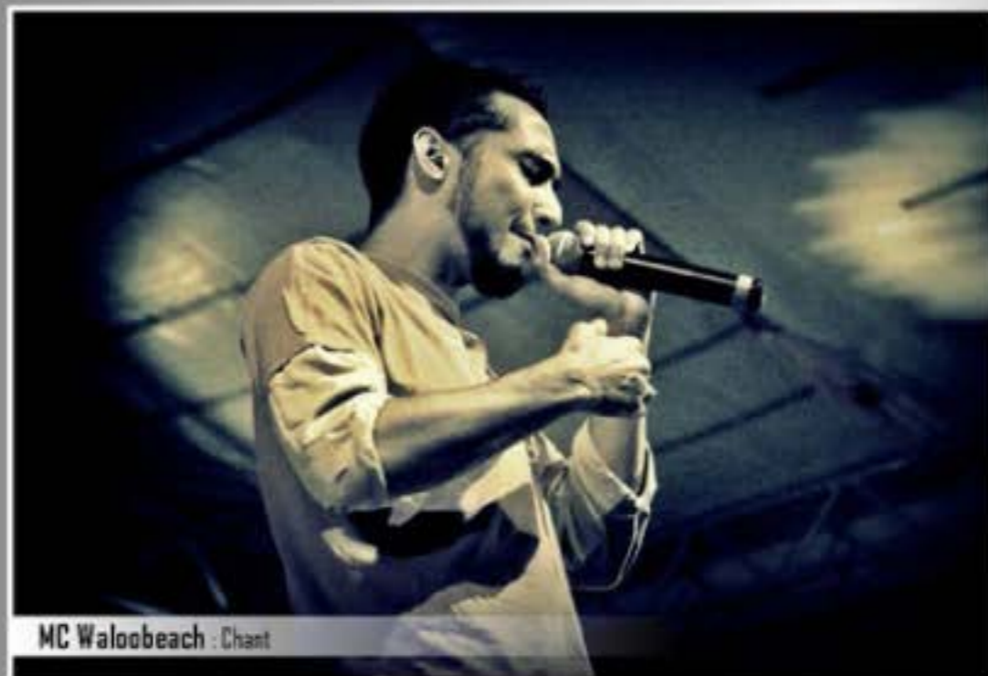
MC Waloo beach : Chant