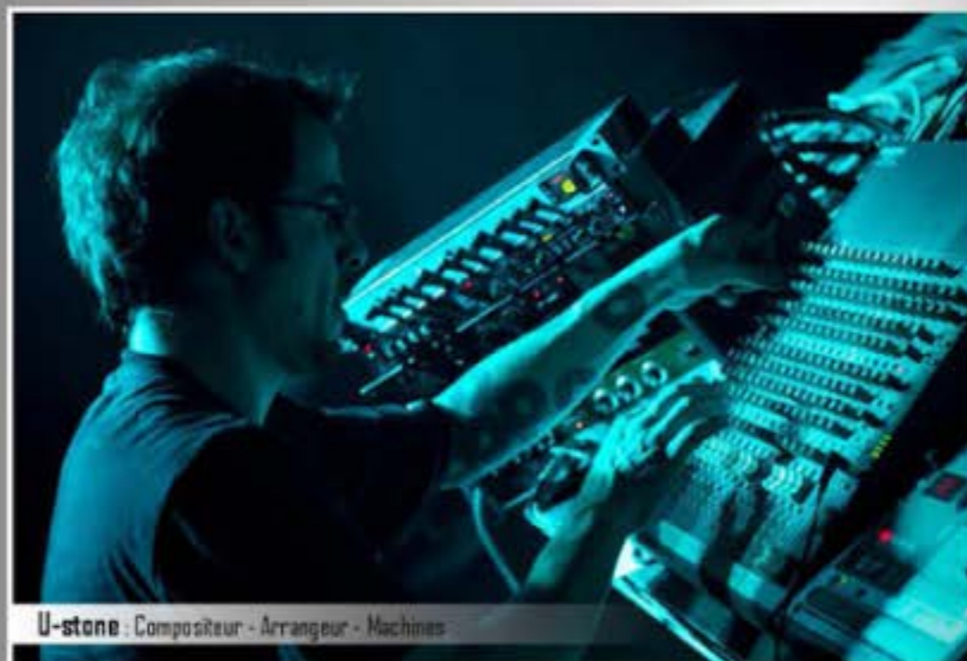
U-stone : Compositeur - Arrangeur - Machines